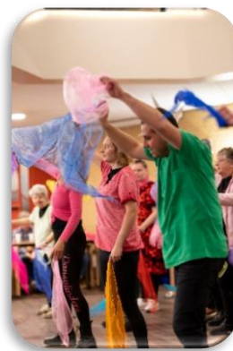
foto: Dansvoorstelling door mensen met een beperking.

De Dansvlinders® Methodiek is een lesmethode die vrije expressie en creativiteit bevordert door het te combineren met dans. Kinderen en volwassenen worden in de lessen gestimuleerd om hun creativiteit de vrije loop te laten, door middel van vrije beweging en eigen dans. Binnen deze lessen wordt de Dansvlinders klok gebruikt als basis.